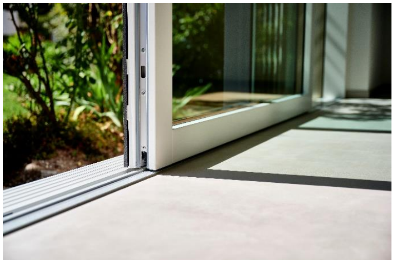
Hebeschiebetür duraslide top. Barrierefreiheit weil Schwellenprofil, Fussboden und Terrassenboden auf gleichem Niveau möglich sind.

Die innovative Schiebetür duraslide top löst die Grenzen zwischen Wohnraum und Natur elegant auf. Die Schiebetür mit grossflächigem Glas und schmalen Profilen zeichnet sich durch höchste Qualität, Langlebigkeit und durchdachte Technik aus.